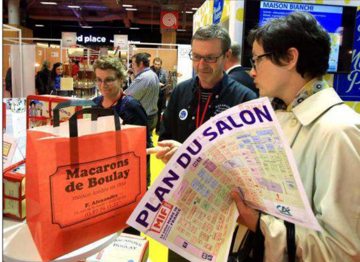
Ce week-end, au salon Made in France porte de Versailles à Paris, Moselle passion sera représentée par les bijoux en cuir de l'Atelier Clause (Metz), Les délices de Lorraine (Hayange), whiskeys et gins de la distillerie du Catur (Troisfontaines), les Macarons de Boulay, la Manufacture Bianchi (Mazières-lès-Metz), Saveurs salées (Langatte), Savonnerie artisanale de Lorraine (Grestenquoy).

Cientèle nouvelle En Meurthe-et-Moselle, beaucoup observent avec envie la façon de faire des Mosellans et leur label Moselle Passion. Conseil départemental et chambre des métiers s'associent pour aménager un stand attractif au cœur du Mif et ses cinq cents exposants. Une façon de valoriser le savoir-faire des sept artisans présents, rencontrer un public qui ne se déplaçait pas forcément jusqu'en Moselle. Une volonté aussi de rayonner au niveau national en montrant des entreprises qui allient tradition et modernité.